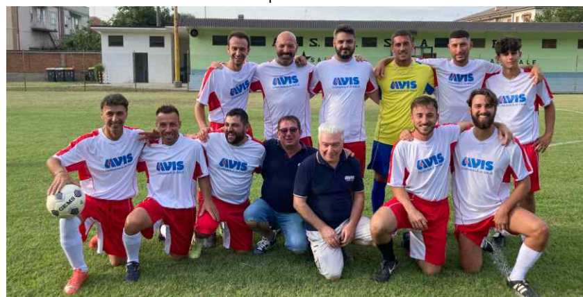
Foto della squadra AVIS con i due «intrusi»: il Presidente e «l'allenatore»