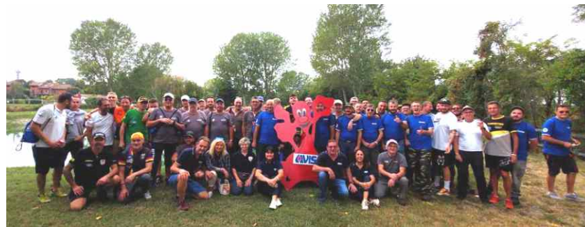
Il folto gruppo di partecipanti alla gara e alcuni momenti...

Come da programma, domenica 17 settembre u.s., si è svolta al Lago delle Rose, il tradizionale raduno di pesca organizzato dalla nostra sezione.