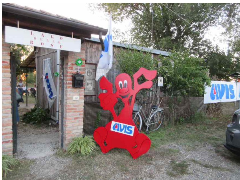
L'ingresso al Lago delle Rose di Sale, avisino per un giorno