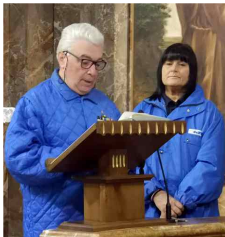
Il Presidente legge il discorso finale