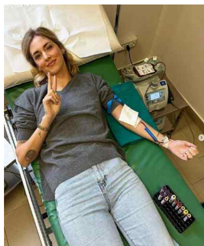
Chiara Ferragni mentre dona

Lo scorso mese di ottobre il noto cantante Fedez a seguito di un'emorragia ha subito un intervento chirurgico durante il quale gli sono state trasfuse alcune sacche di sangue. Per sua fortuna grazie all'abilità dei chirurghi che sono intervenuti ma anche al sangue che gli è stato trasfuso ne è uscito bene e