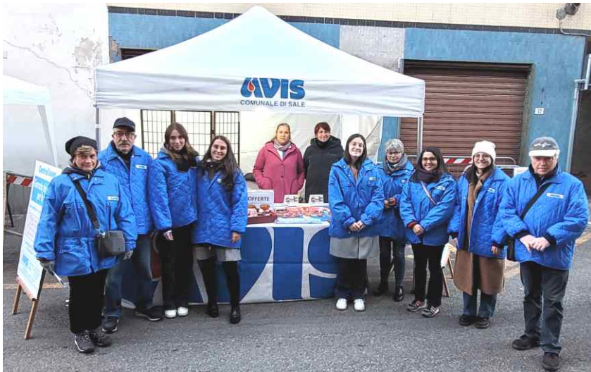
Gli infreddoliti volontari AVIS davanti al nuovo gazebo