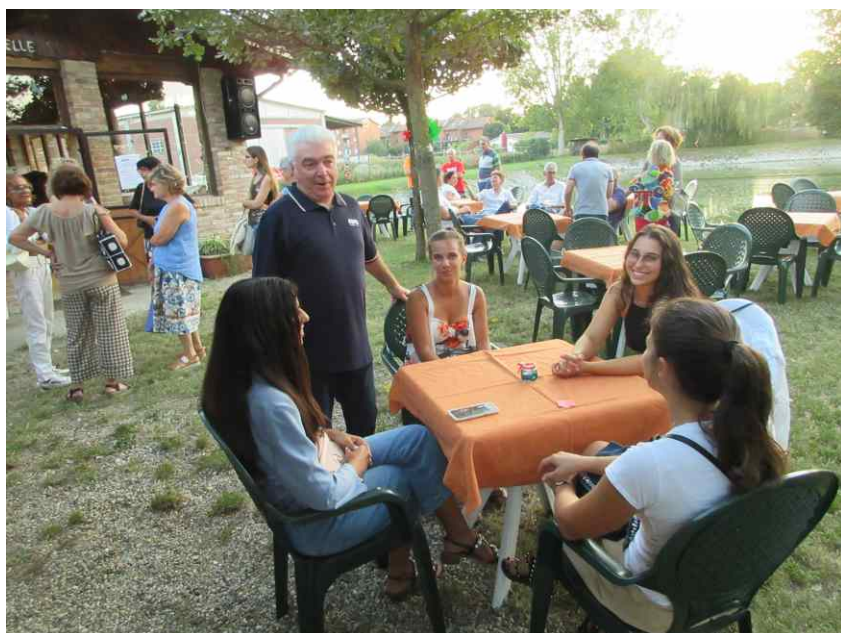
Si chiacchiera aspettando l'arrivo di tutti