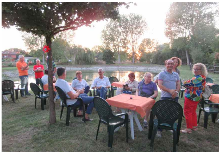
Mentre il sole tramonta ci si prepara alla festa