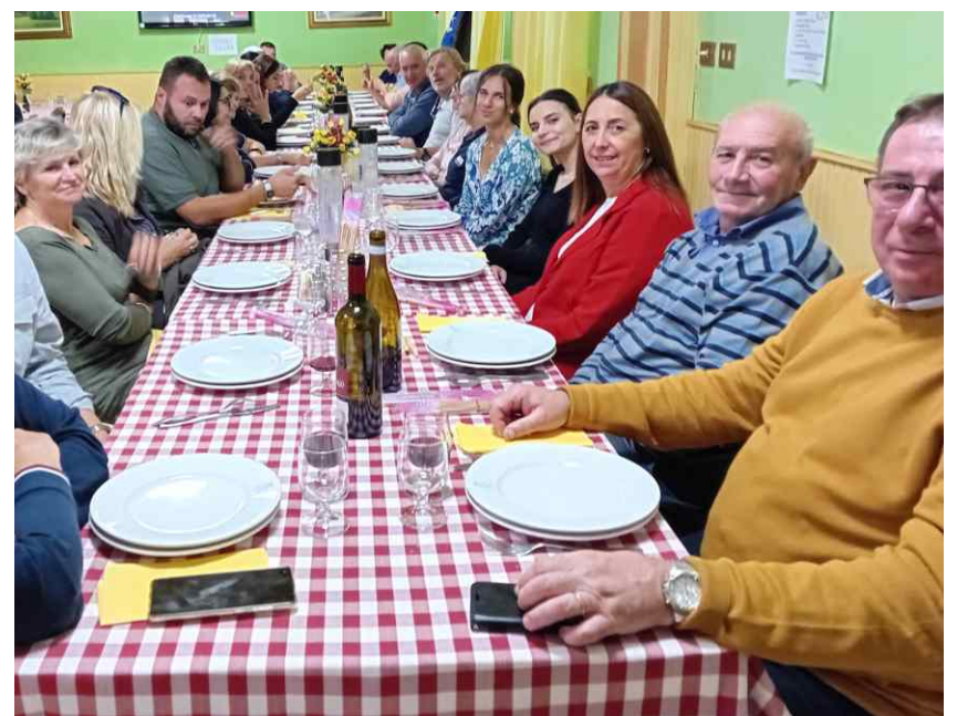
Un sorriso per la foto ricordo