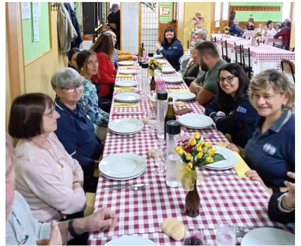
In attesa degli antipasti...

Quest'anno il tradizionale pranzo offerto dalla sezione ai componenti il gruppo prelievi ci ha portati in Lomellina, precisamente a S. Giorgio Lomellina. Nella trattoria tipica gestita da simpatiche signore, abbiamo gustato piatti della tradizione e di stagione. Questo pranzo è una delle poche occasioni in cui possiamo ritrovarci in allegria senza il pensiero di dover fare qualcosa, vuoi per i prelievi, vuoi per altre manifestazioni. Un pomeriggio dedicato allo scambio di idee, ai ricordi, alle proposte, tra le diverse età dei partecipanti.