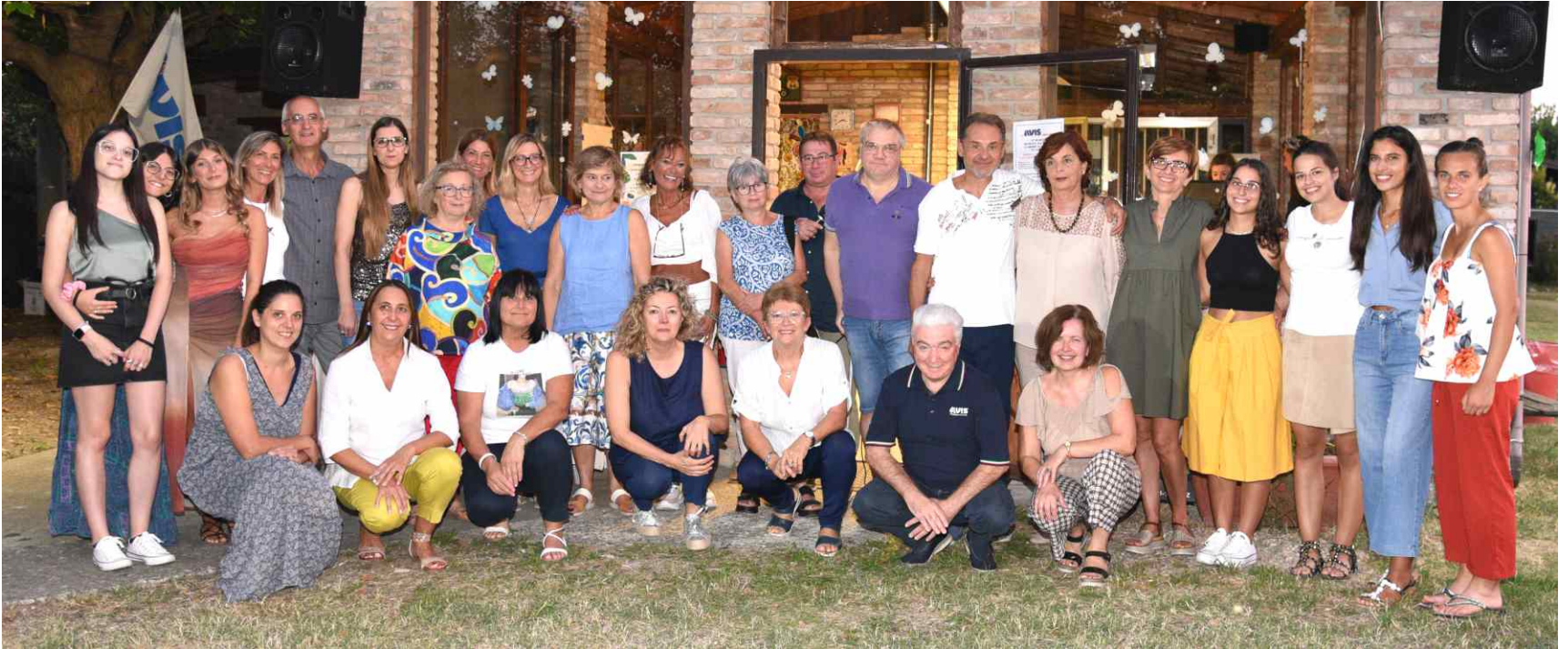
Foto di gruppo dei componenti «in carica» e quelli «in congedo» del Gruppo Prelievi